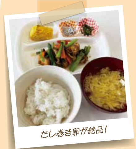
だし巻き卵が絶品!