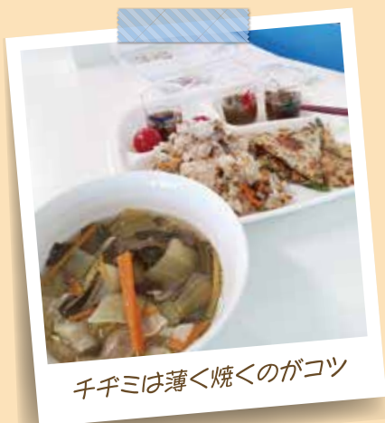
千手ミは薄く焼くのがコツ

参加者からは「初めてもずくに火を通したものを食べま したがおいしかったです」「食べて応援のしゅくみがよくわ かりました」との感想をいただきました。