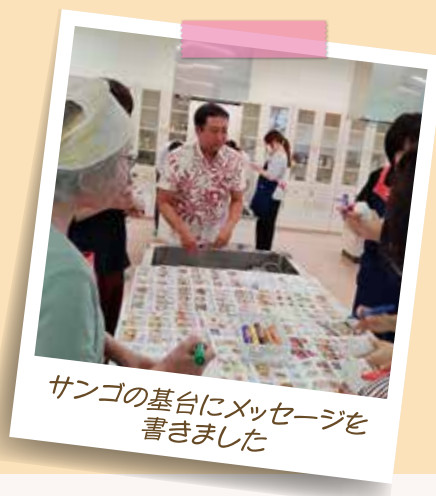
サンゴの基台にメッセージを 書きました