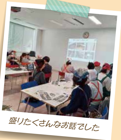
盛りたくさんのお話でした

参加者からは、「幅広くつかえてとても便利な調味料だと 感じました」「スープのたまごがふわふわで驚きました」と の感想をいただきました。