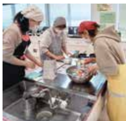
素材がいきる白だし学習会

パルシステムの商品は好き? たべるチームでは食に関する内容を テーマに活動しています。