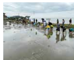
ときめき学校2024田んぼ

産地や生産者に 興味はありませんか? つくるチームでは産地や農業を テーマに活動しています。