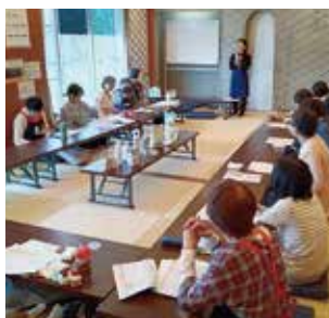
私たちがおすすめ石けん生活