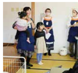
パルdeお楽しみバイキング