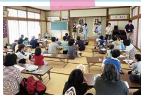
みんなで考えてね