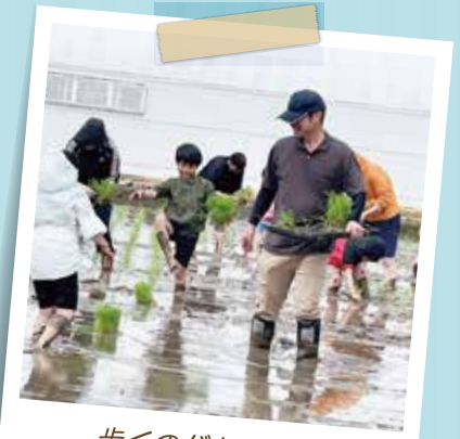
歩くのが上手だね