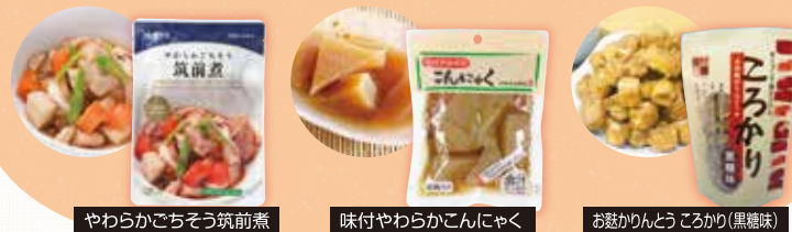
やわらかごちそう筑前煮