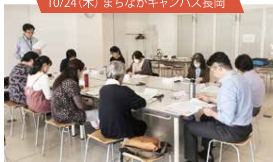
10/24(木) まちなかキャンパス長岡